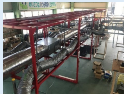
AHU系統ダクトモックアップ