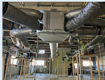
同上分岐チャンバー (ダンボール)